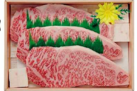
▶JA全農いばらき 常陸牛ロース ステーキ用 200g×3枚

●JA全農いばらき 常陸牛ロース ステーキ用 200g×3枚 …12,625円(税込)