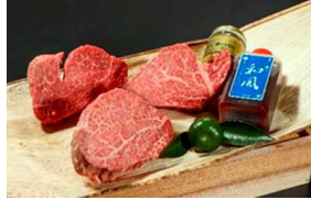
▲常陸牛 吟撰極上ステーキ 3種セット